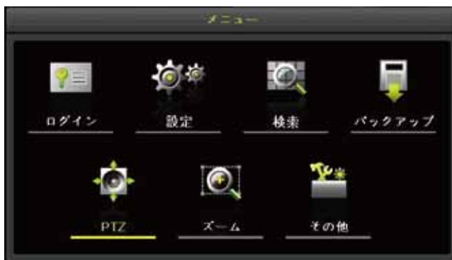
録画機のメインメニュー